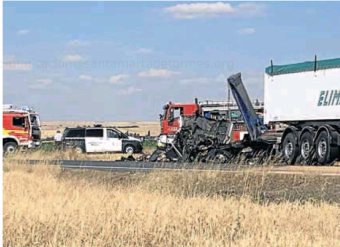
Imagen de un accidente en Macotera que se saldó con dos camioneros muertos. ICAI

Así lo refleja el balance de siniestralidad en vías interurbanas de la provincia de Salamanca de la Dirección General de Tráfico al que ha tenido acceso Ical, en el que se apunta a la reducción media de la movilidad en un 25 por ciento con respecto a 2019, debido a la situación de excepcionalidad provocada por la pandemia de la covid-19, como causa del descenso del número de