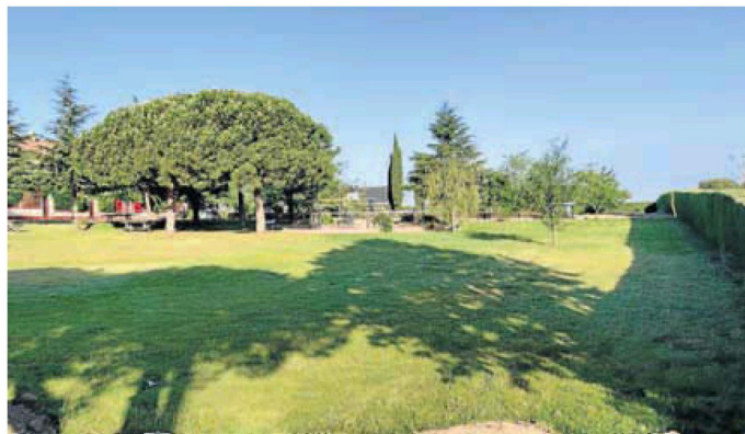
Aspecto de uno de los solares que ha limpiado el Ayuntamiento de la localidad. word

Los dueños de parcelas, que por tanto no cumplan con esta norma-