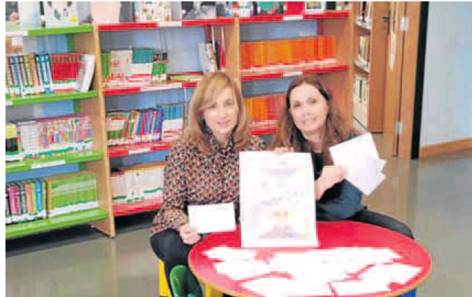
Presentación del Concurso de Lecturas Postales, en el que participa la biblioteca de Carbajosa. WORD

La Biblioteca municipal ha sido hermanada con la biblioteca Jesús Vallinam de Comillas (Cantabria) y serán los niños de ambos