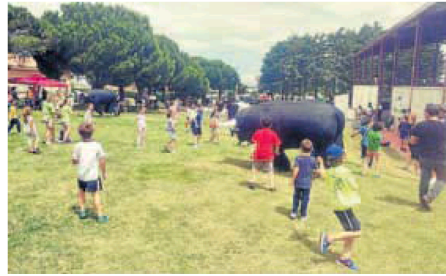
Una de las actividades festivas de la localidad. word

lermo Rivas, ha explicado que «buscamos dar una vuelta a las fiestas para que tengan un nivel, en todos los sentidos, acorde a lo que Carrascal de Barregas y las diferentes urbanizaciones merecen». El primer edil de Carrascal