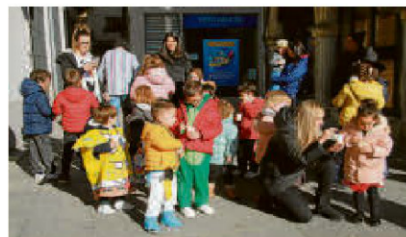
Los más pequeños, con sus disfraces.

A medianoche llegó la Nochevieja oficial para los adultos que incluyó tanto las 12 uvas, como un sorteo y también toro de fuego con buscapiés.