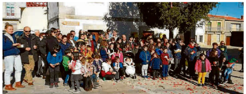
Adultos y pequeños de Santibáñez de Béjar han compartido una Nochevieja muy especial en la mañana del día 31 de diciembre para que el público infantil comiera recibiera el Año Nuevo con las campanadas. | TEL