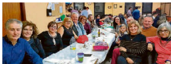
Los integrantes de la asociación cultural Los Miliarios de Calzada de Valdunciel, celebraron su primera gran cena de Navidad.