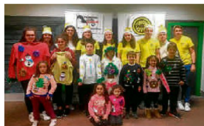
Este grupo de jóvenes ha disfrutado de un taller para decorar jersey con temática navideña gracias a la asociación Cespedosa Joven. | TEL