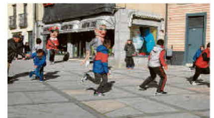
Las carreras de los chavales ante los cabezudos.