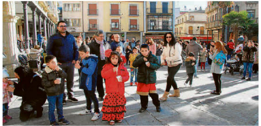
La Plaza Mayor acogió la décima edición de la fiesta de la Nochevieja infantil con la degustación de los 12 gusanitos.

Niños y mayores acudieron a la fiesta en la que comieron 12 gusanitos