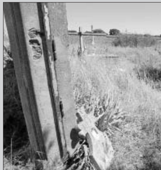
Estado de la puerta de entrada y de las tumbas del cementerio del hospital de Los Montalvos.